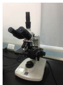
生物显微镜 Biological Microscope