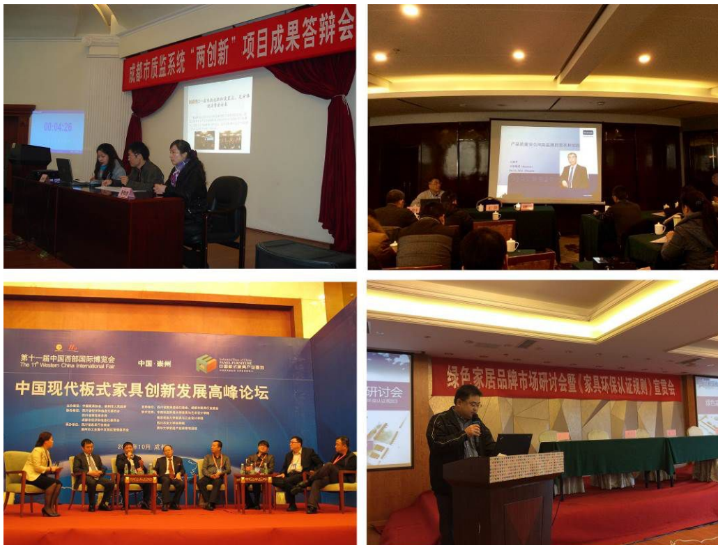
中心人员参与技术交流及会展

展检验领域、开发检验项目的同时，有目的的培养既能冲在检验第一线又能承担科研课题研究的高素质专业技术人员。2014年继续进行成都市质监局科技项目——《黄花梨木的高效液相色谱鉴定方法的研究》；在国际会议上发表论文1篇，中文核心科技期刊上发表了论文1篇，具有较高的影响。