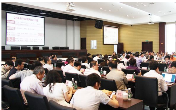
中心通过 CNAS 的实验室监督和扩项评审

久发展的源泉，2014 年中心两院整合引进专业人员 4 名，同时制定了技术人员培训计划，主动将检验业务技术骨干送出去学习先进经验和技术，让他们能及时充电，中心先后派出 4 批次共 4 人次前往外部进行培训学习，将先进的管理经验和检测技术合理转化为用于自身检验能力提升和业务拓展的理论依据；及时安排中心骨干人员参加 ISO 17025 标准及实验室管理知识学习；同时从政策上鼓励专业技术人员利用业余时间学习相关专业知识，在技术职称晋升、岗位任用上不拘一格、不论资排辈，这些做法有效调动了中心全体人员的积极性，形成了创先争优的良好氛围。现在中心的高级技术人员达 42%，直接从事家具产品检验、分析的高级工程师就达 3 人，在家具性能检测方面有一名学科带头人。