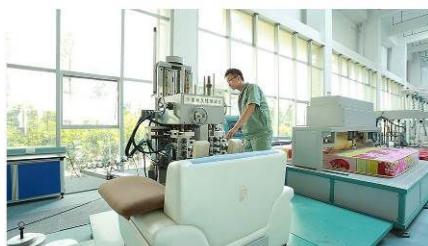
沙发耐久性 试验机 Sofa Durability Tester