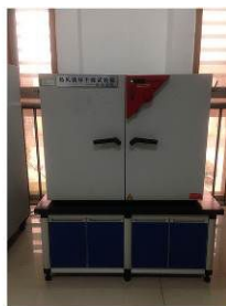
恒温恒湿试验机 Constant temperature and humidity testing machine