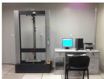
万能力学试验机 Universal mechanical testing machine