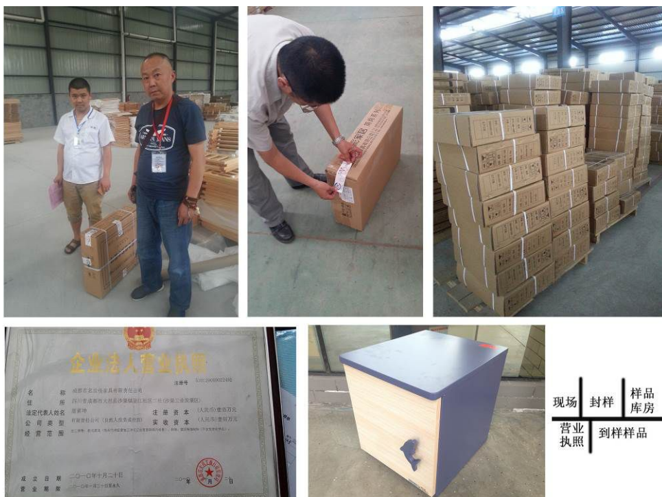
国家监督抽查过程掠影

四川省质量技术监督局、成都市质量技术监督局对家具产品的质量监督检查检验工作；省市局对家具产品的风险监测工作；家具产品 CQC、十环自愿认证检验工作；同时充分利用中心的检验技术优势，为地方企业提高家具产品质量提供积极有效的委托检验服务。2014 年全年共完成各类检验 6036 批次，其中包括 50 批次家具产品自愿认证委托检验，20 批次儿童家具国家监督检验，50 批次木家具国家质检总局的国省联动检验，4771 批次的社会委托检验。在传统业务的检验基础上积极开展质量鉴定检验，为西部地区家具行业的有效监管作出了贡献，社会效益较大。