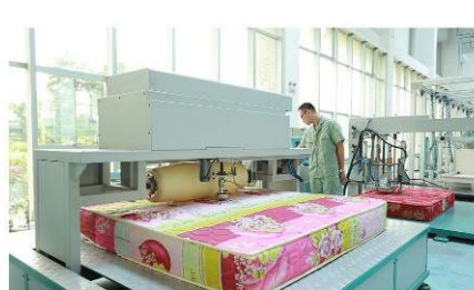
床垫耐久性试验机 Mattress Durability Tester