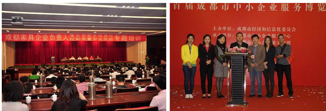
中心人员参与的部分培训及服务企业活动

采取走访企业、到其他检测机构参观等方式，不断开拓中心员工的视野，强化专业素养。三是要求检验人员接到企业提问，不推诿不搪塞，必须给予满意答复。四是通过召开标准宣贯会、发放反馈信息表等方式，积极向客户开展业务宣传，虚心听取客户的意见和建议。五是持续优化业务流程，改进作业方式，努力减轻企业负担，为企业增值提供服务。