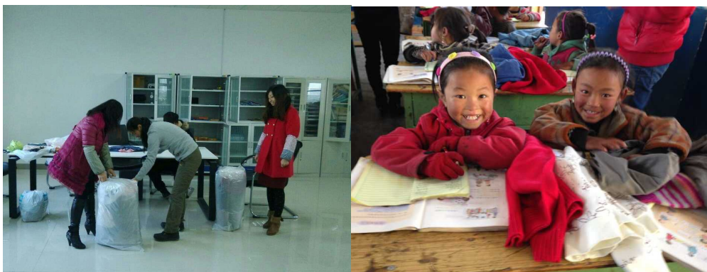
中心为凉山州昭觉县的学生捐赠过冬衣物

中心一直积极参与社会公益活动。每年 315 期间，中心都会参与消费者协会组织的相关活动，为消费者普及建材产品方面的相关知识。汶川地震、芦山地震期间，中心以最快的速度对建材产品类救灾物资进行质量检验，以便能尽快进行灾后重建工作。同时中心积极组织员工参与捐赠资金、衣物和生活用品等活动。今年 12 月，中心组织向四川大学支教团支教的凉山州昭觉县的同学捐赠了过冬衣物，小朋友幸福的笑脸是对我们最好的回应。