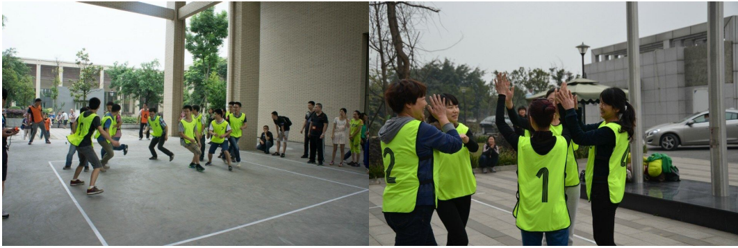
员工运动会和女子气排球比赛掠影